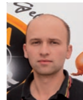
U. Himmelberger Winterthur

Montag bis Freitag: 08.00 bis 12.00 Uhr 13.30 bis 18.30 Uhr Samstag: 08.00 bis 16.00 Uhr durchgehend