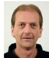
B. Vogelsanger Bachenbülach

Montag bis Freitag: 08.00 bis 18.30 Uhr durchgehend Samstag: 08.00 bis 17.00 Uhr durchgehend